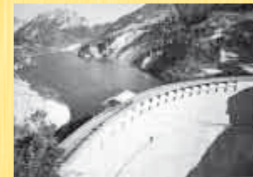
DIGA DEL VAJONT