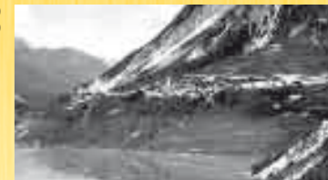
ERTO CON IL LAGO