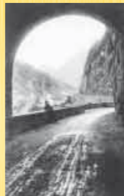
STRADA PER ERTO