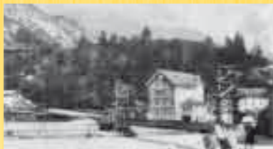
PONTE E VILLA MALCOLM

Sarà quindi un suggestivo passo indietro nel tempo poter percorrere tracciati ricchi di storia come la vecchia strada del Colomber , le gallerie , il ponte canale , la cava dei Pascoli , l'intero coronamento della diga , attraversare la frana del Toc , transitare per la vecchia Erto e poi per il trui dal sciarbon , salire a Casso , scendere a Codissago per il troi de Sant'Antoni e raggiungere Longarone per la zona Malcolm .