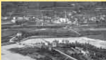
PANORAMA DI LONGARONE CON LA BORGATA DI VAJONT E IL PONTE CAMPELLI