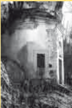
CHIESETTA DI SANT'ANTONIO